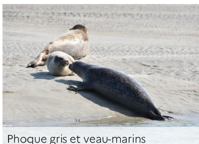
Phoque gris et veau-marins

Vous apercevez un phoque sur la plage. Il peut s'agir d'un phoque veau-marin ou d'un phoque gris. D'un adulte ou d'un jeune. Il est seul ou en groupe. Une seule consigne : ne pas causer de dérangement. C'est une espèce protégée !