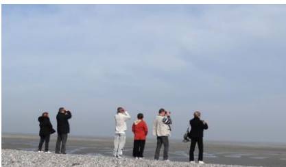
Observation de phoques

Parfois, pendant la période de reproduction, un jeune phoque peut sembler abandonné ou isolé. Mais attention, il n'est pas forcément en détresse ! La plupart du temps, il est simplement dans une situation de repos et d'attente du retour de sa mère. La présence d'humains à proximité peut alors empêcher celle-ci de le rejoindre. En cas de découverte d'un jeune phoque, le mieux est de s'éloigner et de maintenir la plus grande zone de tranquillité possible autour de l'animal.