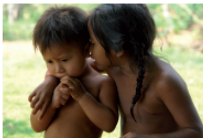
Enfants d'Imawapin, 2007

« Dirty Paradise » est une histoire vraie, celle du peuple Wayana, des Indiens français d'Amazonie dont la malédiction est de vivre dans une région recelant de l'or. L'exploitation incontrôlée de cette richesse porte en corollaire une détérioration profonde de l'écosystème de la forêt, une pollution irréversible des cours d'eau, ainsi que d'innombrables violations des droits humains fondamentaux.