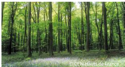
Forêt de Retz - Hêtraie à Jacinthe des bois

Le territoire accueille une diversité de paysages et de milieux naturels. Les cultures, les prairies, les vastes peuplements forestiers, les pelouses sèches nichées dans les coteaux, les zones de sources, marais et étangs, les cours d'eau diversifiés, le réseau de carrières souterraines, les jachères et les friches sont autant d'habitats différents abritant de nombreuses espèces animales et végétales.