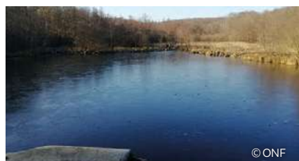
L'étang de la Petite Ramée, après rajeunissement concerté en 2019

Les zones humides font partie des écosystèmes les plus riches car elles accueillent de nombreuses espèces faunistiques et floristiques. Cependant, cette richesse est encore insuffisamment connue et sauf exceptions, elle apparaît très fragile et largement menacée.