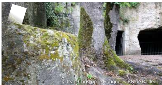
Carrières de Confrécourt (Nouvron-Vingré)

Près de 400 sites accueillant des chauves-souris en hibernation sont connus sur le territoire. Le Conservatoire d'Espaces Naturels des Hauts-de-France gère 5 sites de carrières souterraines. Pour les préserver et éviter le dérangement des chauves-souris en hibernation, des grilles sont installées à l'entrée des sites. Cette mesure pourrait être appliquée à l'ensemble des carrières.