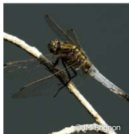
Orthetrum réticulé - Orthetrum cancellatum