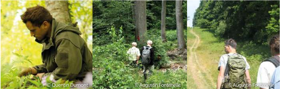
Prospections flore à Longpont, au Bois Hariez, et sur l'Allée Royale en forêt de Retz

Un ABC est une démarche qui permet à une commune ou une structure intercommunale de connaître, de préserver et de valoriser son patrimoine naturel.