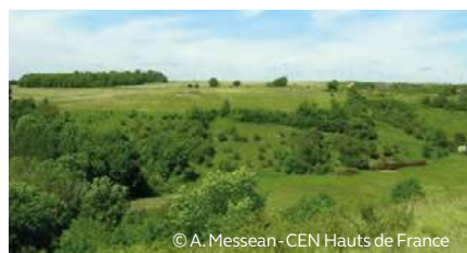
Les coteaux de Vivières

Elles abritent une partie importante du patrimoine naturel local pour certains insectes et reptiles et une flore toute particulière.