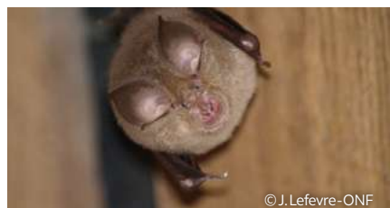
Petit Rhinopole - Rhinolophus hipposideros

L'exploitation du calcaire pour édifier le bâti traditionnel du territoire a donné naissance à de très nombreuses carrières souterraines. Ce réseau de carrières héberge aujourd'hui une très grande diversité d'espèces de chauves-souris.