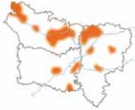
Figure 1 : principaux secteurs actuels de reproduction du Busard des roseaux