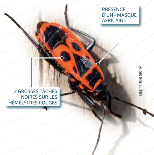
Couple de Gendarmes